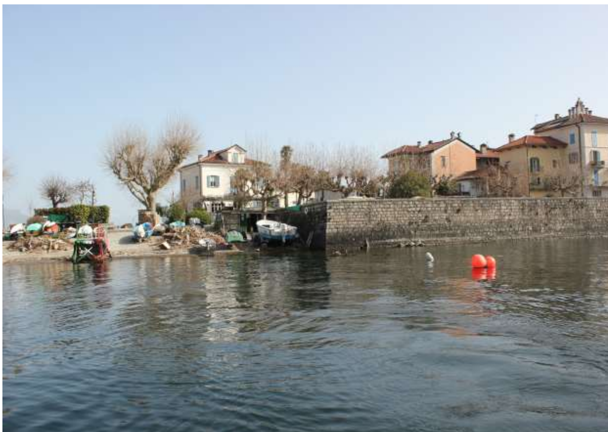
1 Vista del lago, prospetto sud-ovest