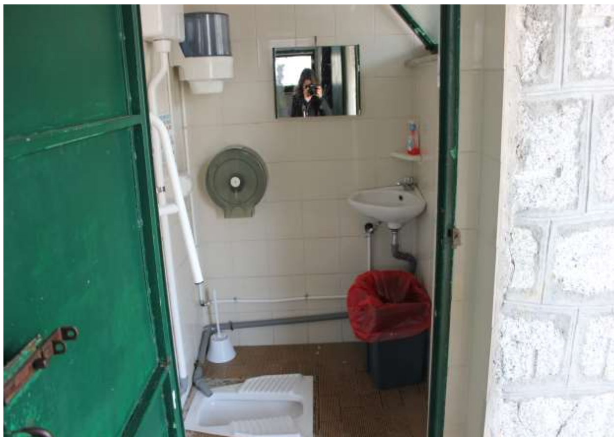
19 Particolare interno: servizi igienici singoli.