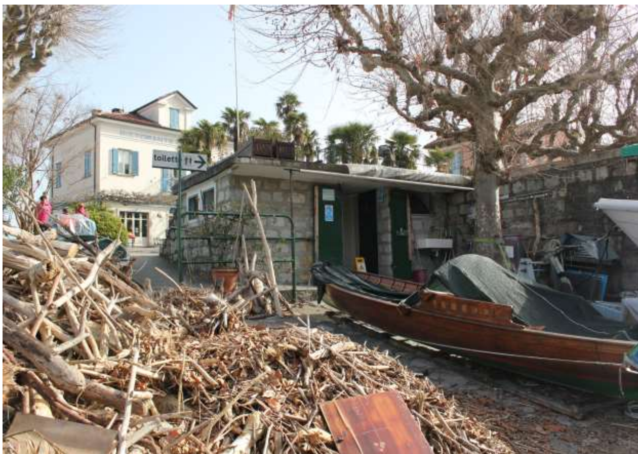
4 Vista dalla riva, angolo Ovest ed entrata fabbricato.