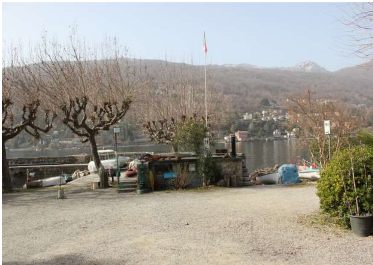
10 Vista da via lungo lago, prospetto Nord-Est