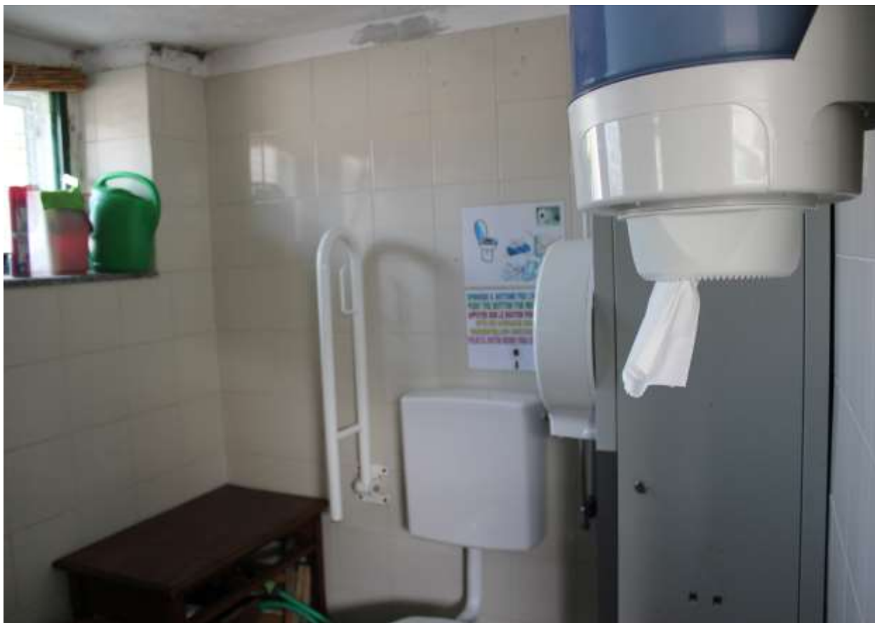
17 Particolare interno dell'attuale servizio per disabili.