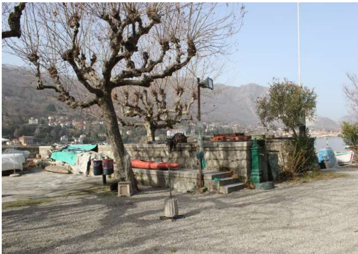
12 Vista da via lungo lago, angolo Est.