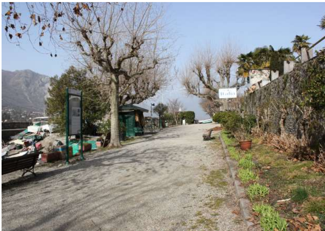
16 Via Lungo Lago, nell'avvicinarsi al manufatto.