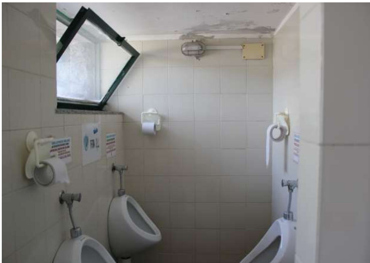
20 Particolare interno: area orinatoi.