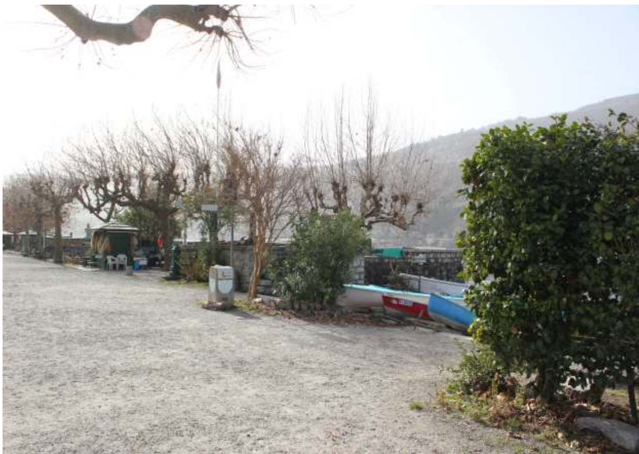
7 Vista da via lungo lago, angolo Nord.