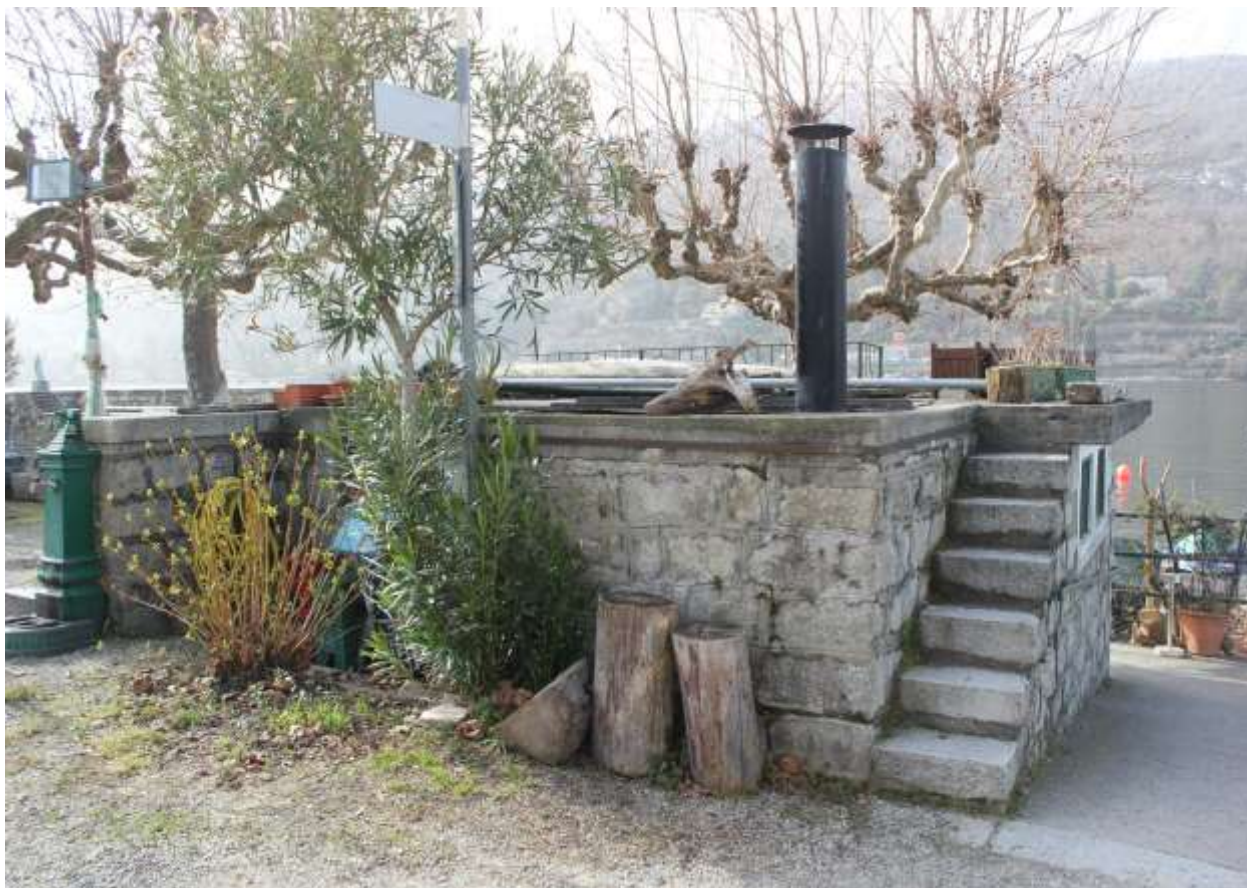
11 Vista da via lungo lago, angolo Nord, particolare scala di accesso alla copertura.