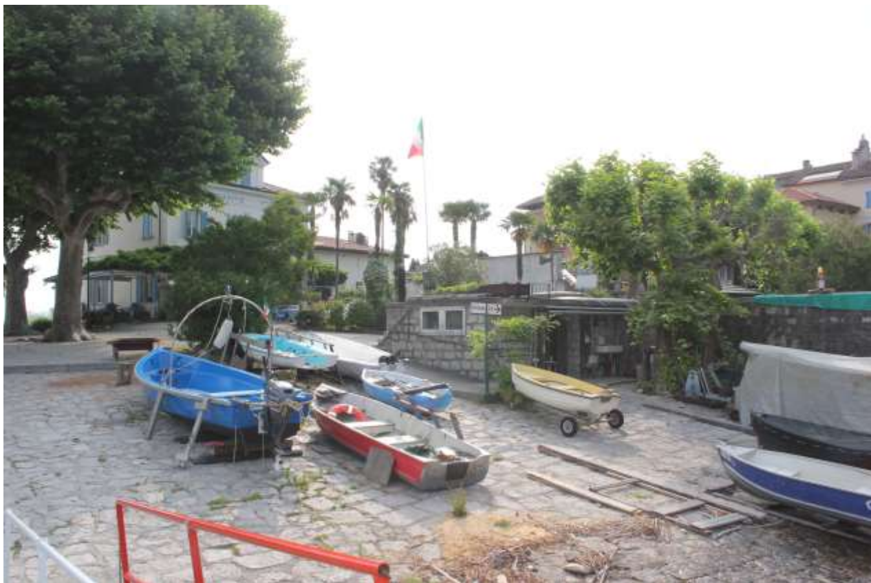
Immagine numero 6, consistenza attuale.