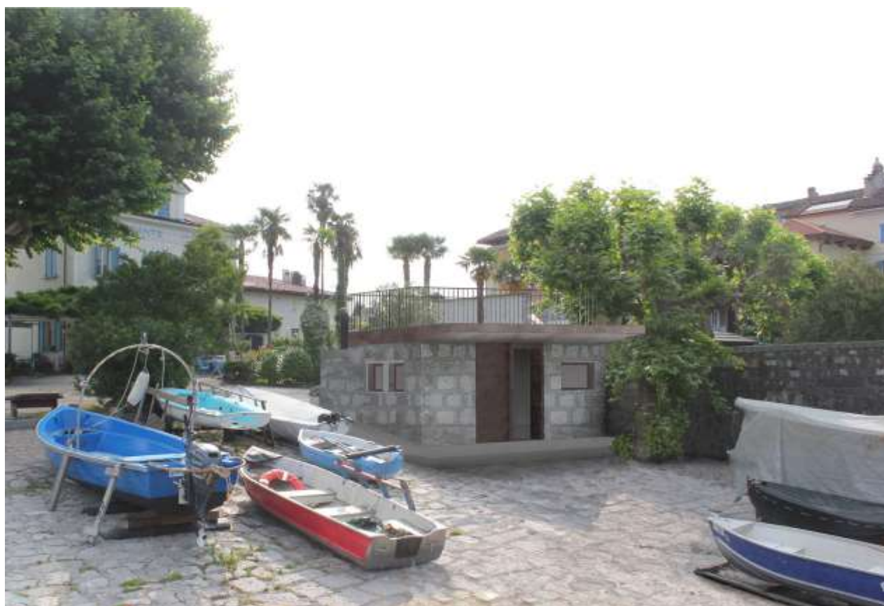
Inserimento ambientale, vista da lago.