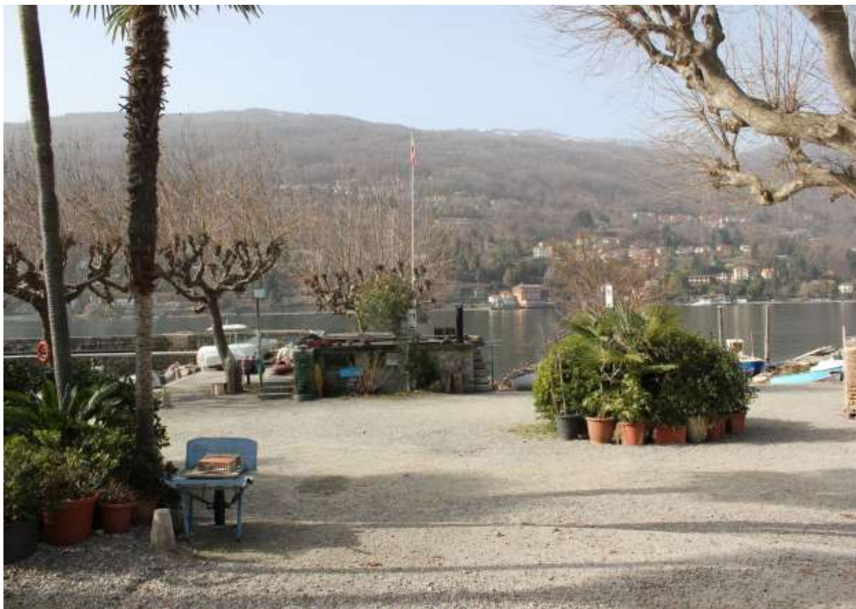
9 Vista da via lungo lago, prospetto Nord-Est