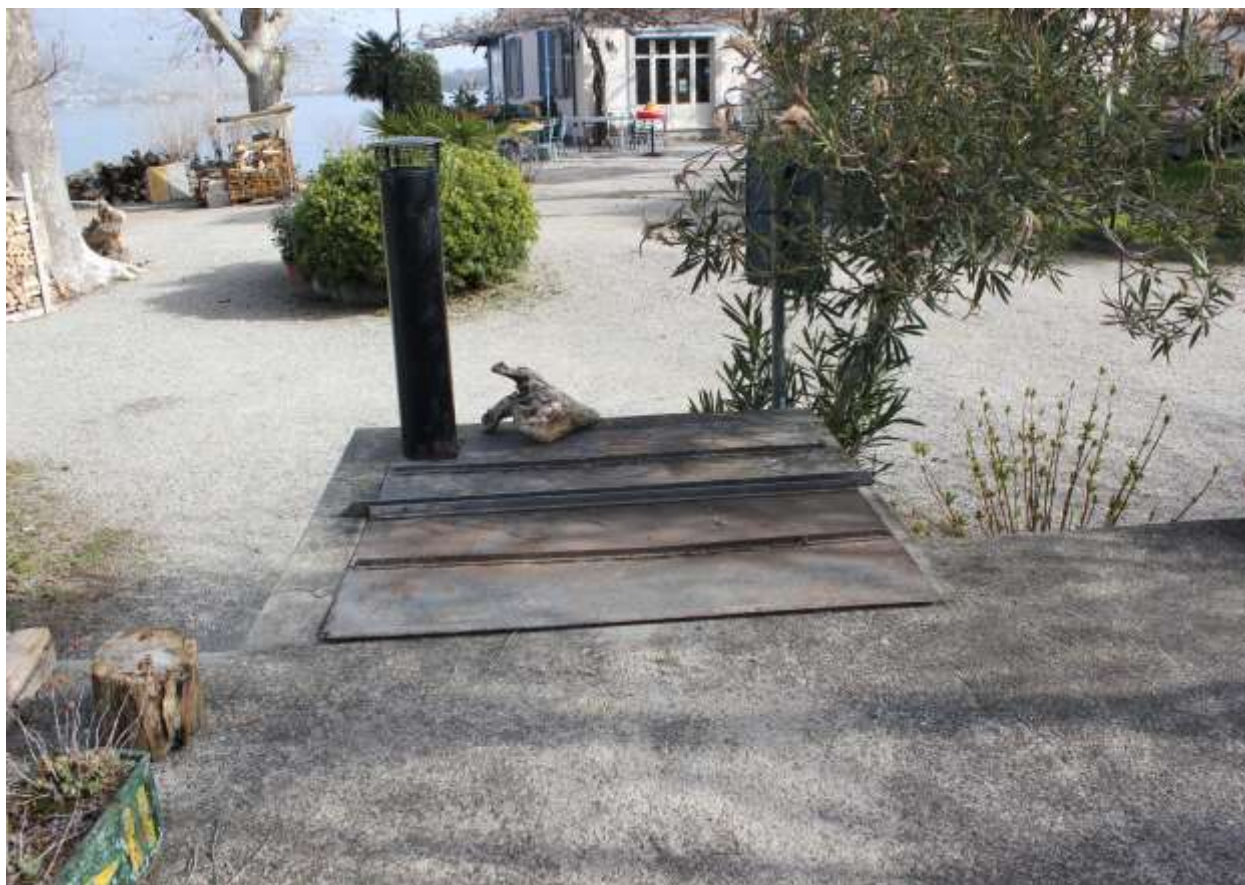
14 Particolare della copertura, vasca di tintura reti (ora coperta con lamiera).