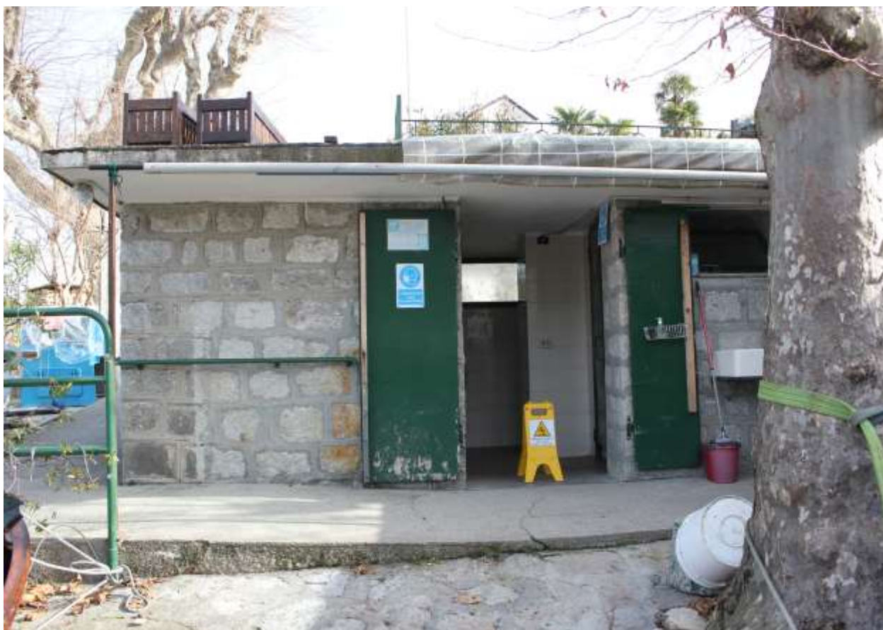
5 Vista prospetto Sud-Ovest, entrata fabbricato.