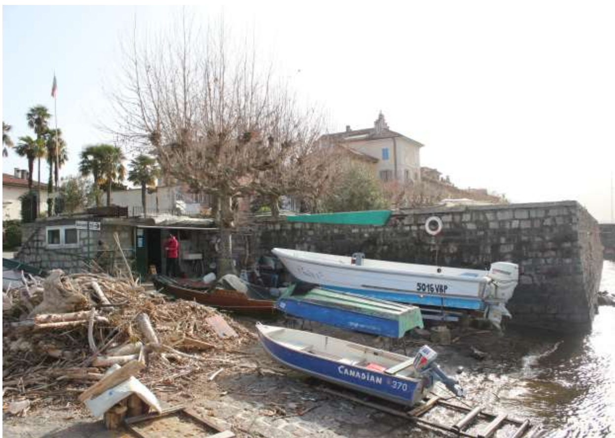
3 Vista dalla riva, angolo Ovest ed entrata fabbricato.