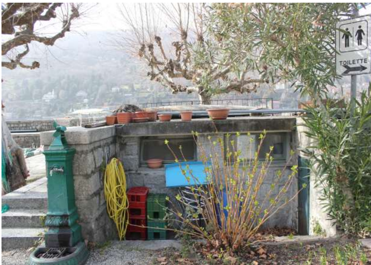
13 Vista da via lungo lago, prospetto Nord-Est.