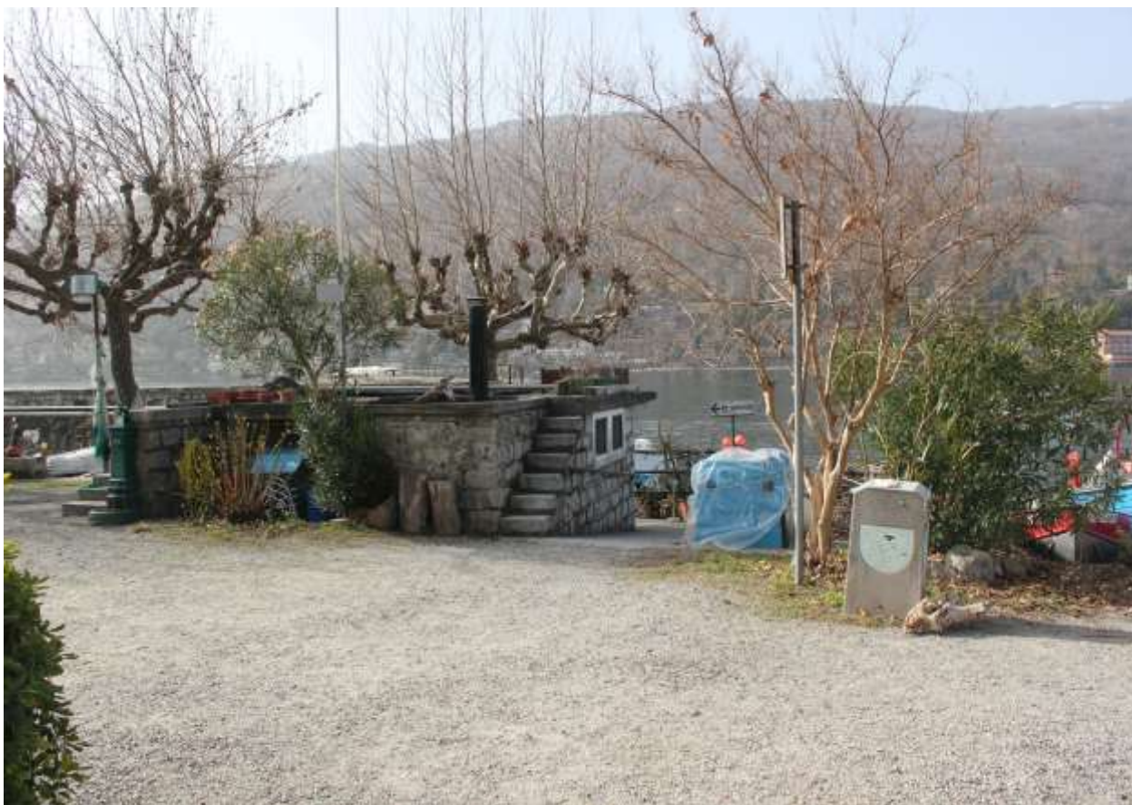
8 Vista da via lungo lago, angolo Nord.