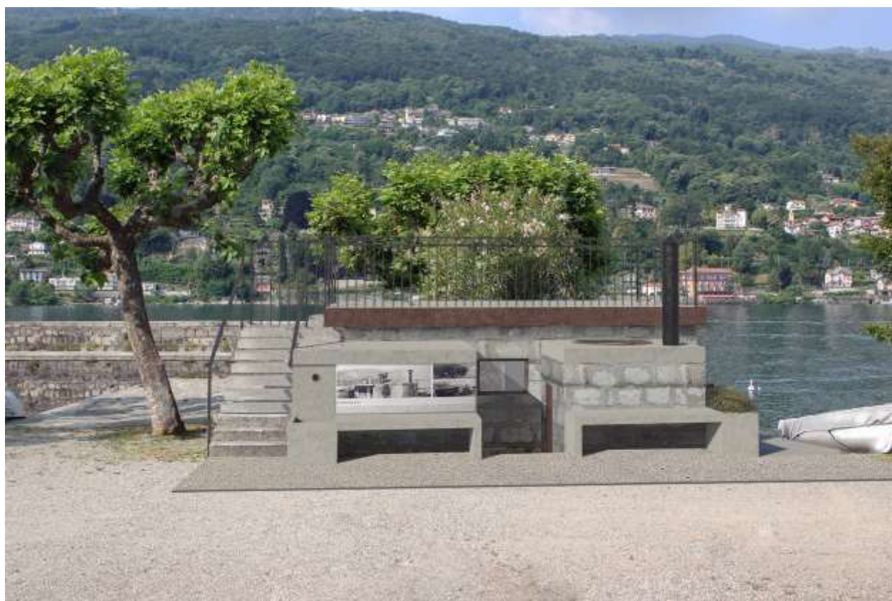
Inserimento ambientale, vista prospetto Nord-Est