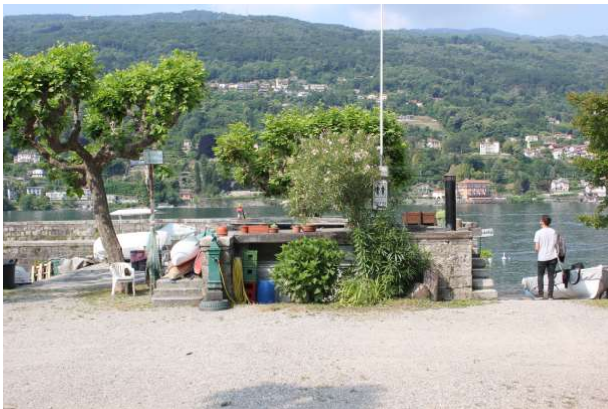
Immagine numero 10, consistenza attuale.