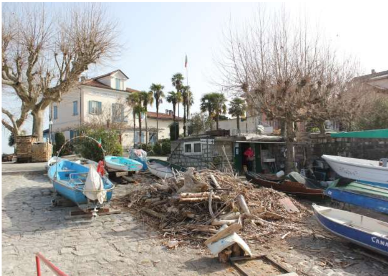
6 Vista dalla riva, angolo Ovest ed entrata fabbricato