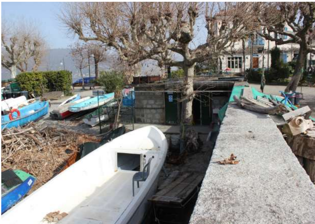
15 Vista prospetto Sud-Ovest.