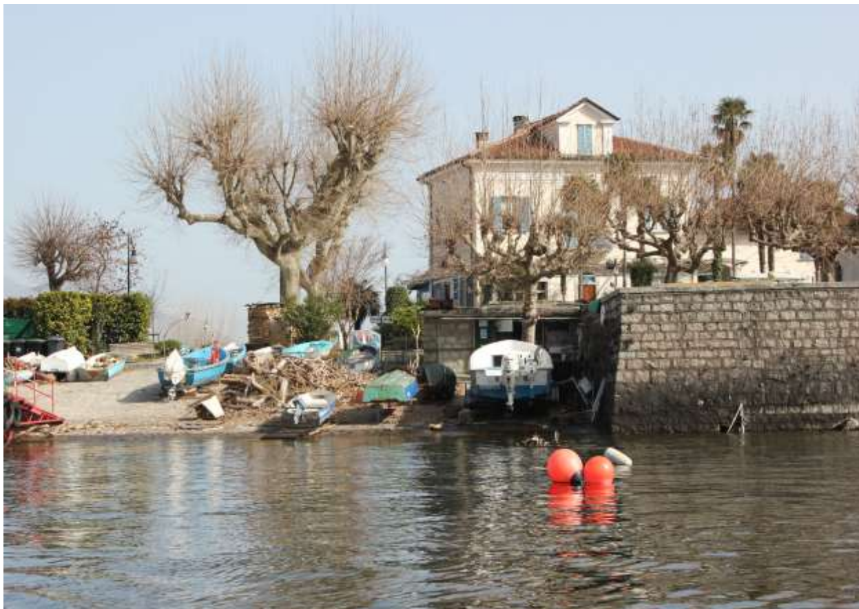
2 Vista del lago, prospetto sud-ovest